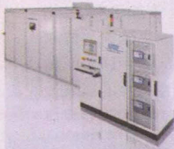
LPKF Allegro™ 高效率產用雷射劃線機