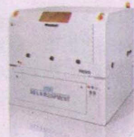
LPKF Presto™ 實驗室用雷射劃線機

338桃園縣蘆竹鄉南崁路一段231巷36號 TEL:(03)222-3170 FAX:(03)222-3150